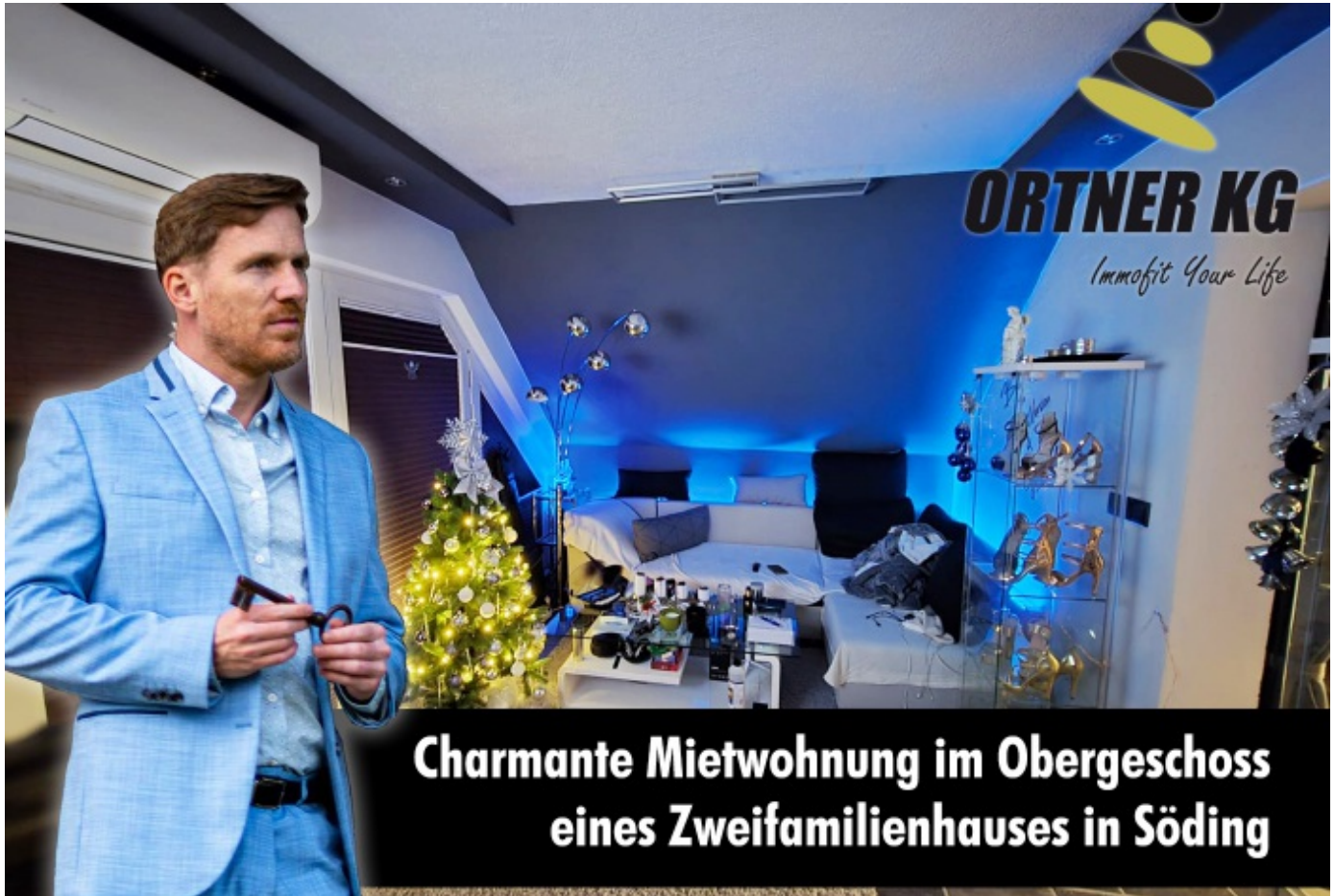
Charmante Mietwohnung im Obergeschoss eines Zweifamilienhauses in Söding